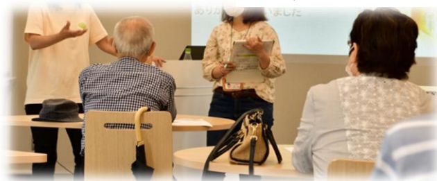
認知症サポーターカード

講座を受講された方には、認知症の方やそのご家族を応援する目印として、「認知症サポーターカード」をお渡しします。